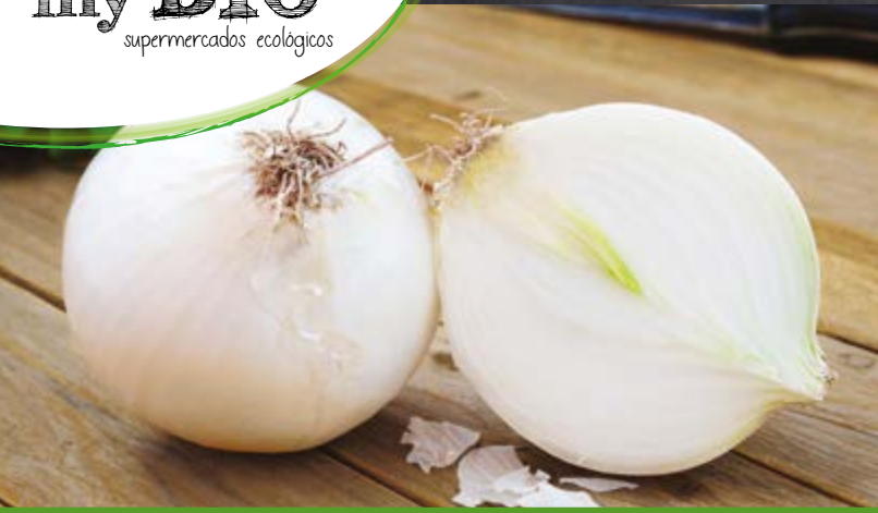
Cebolla blanca, Kg