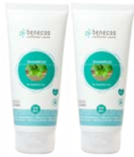
Champú de Ortiga y Melisa, 200 ml