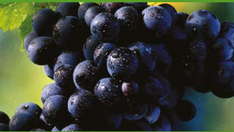
Uva negra, Kg