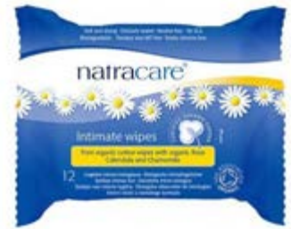
Toallita Higiene Íntima, 12 uds.