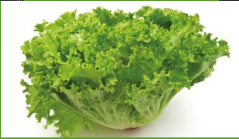
Lechuga batavia, Pieza