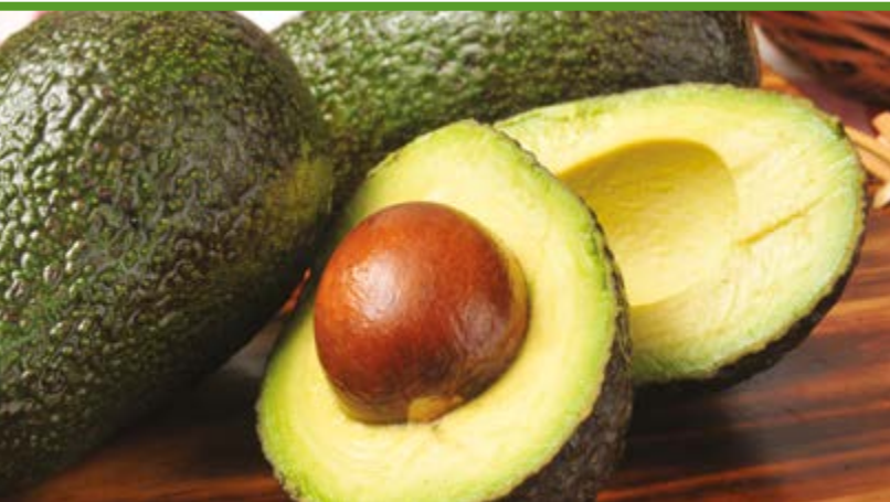
Aguacate bacon, Kg