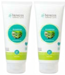
Champú de Aloe Vera, 200 ml