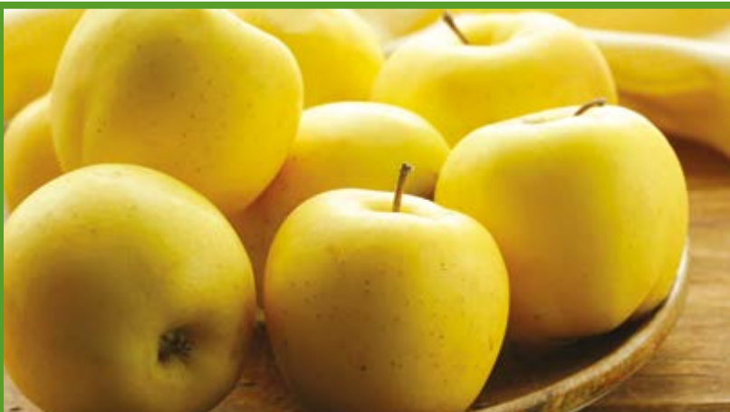
Manzana golden, Kg