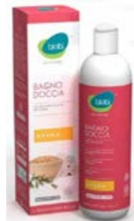
Gel de Ducha de Avena, 250 ml