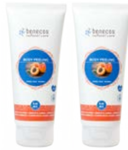
Gel de Ducha exfoliante, 200 ml